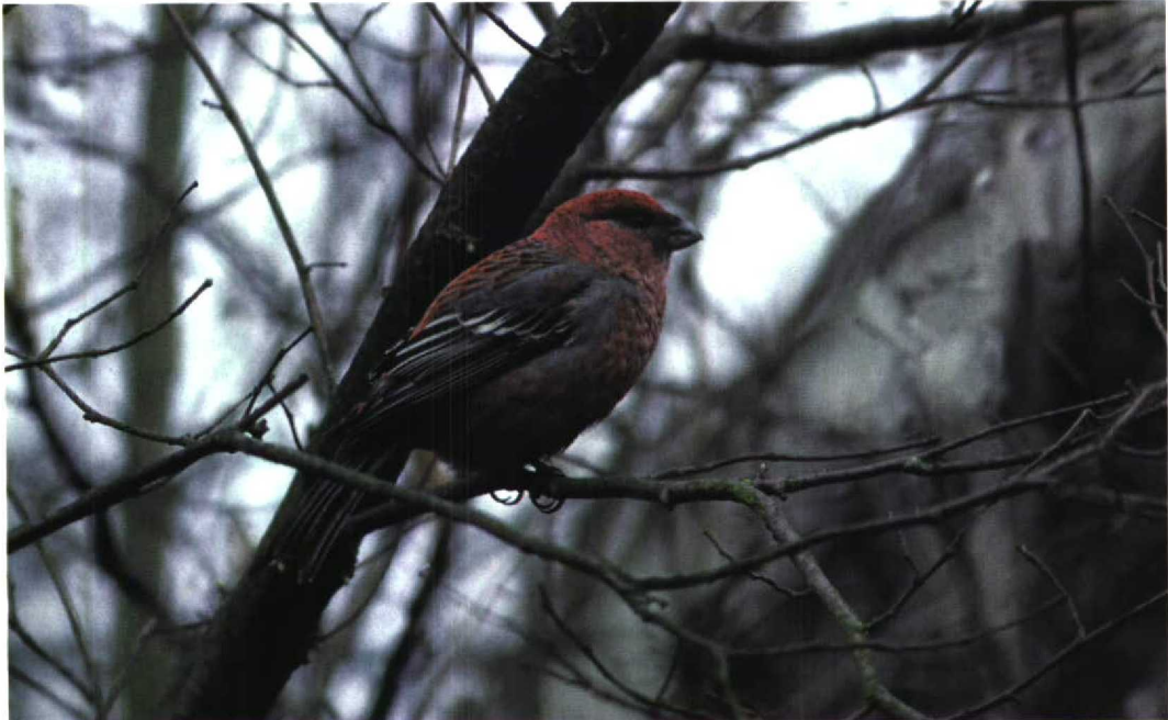
36 Haakbek / Pine Grosbeak Pinicola enucleator , Melissant, Zuid-Holland, 24 maart 1996