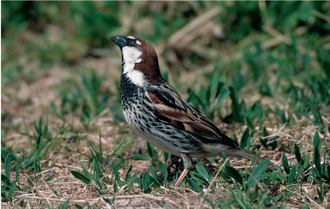
236 Spaanse Mus / Spanish Sparrow Passer hispaniolensis , adult mannetje, Camperduin, Noord-Holland, 13 mei 2000 (Jan van Holten)

De beschrijving is gebaseerd op aantekeningen van Max Berlijn en foto's van Marc Guyt en